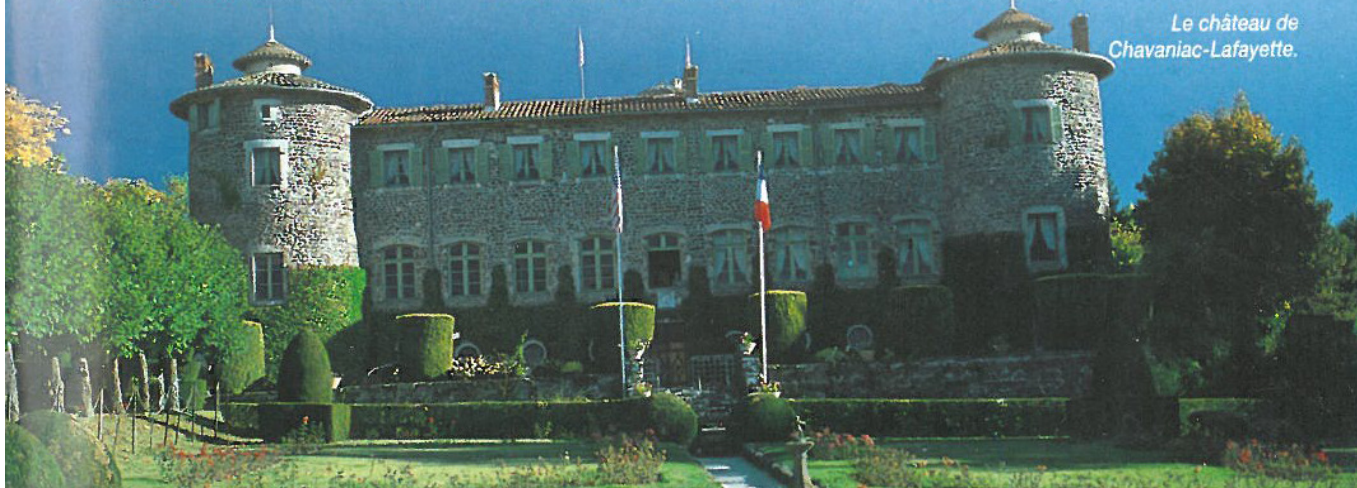
Le château de Chavaniac-Lafayette.

vant, prendre à gauche, puis à droite au prochain. Délaissier un chemin à droite. Traverser le ruisseau de Lidenne et atteindre Soulages (four banal, puits). 5 Tourner à droite sur une large piste qui arrive sur le plateau. Dans un virage, en vue des maisons, quitter cette piste pour un chemin à gauche. Traverser un ruisseau et regagner le départ.